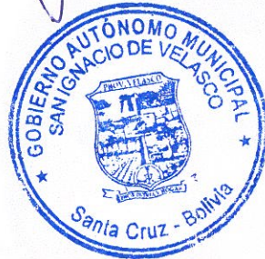
Moisés Fañor Saices Lozano Alcalde del Gobierno Autónomo Municipal de San Ignacio de Velasco

Por tanto, la promulgo para que se tenga y cumpla como Ley Municipal del Gobierno Autónomo Municipal de San Ignacio de Velasco a los treinta días del mes de septiembre de dos mil veinte años.