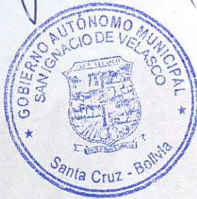
Moisés Famer Saices Lozano Alcalde del Gobierno Autónomo Municipal de San Ignacio de Velasco

Por tanto, la promulgo para que se tenga y cumpla como Ley Municipal del Gobierno Autónomo Municipal de San Ignacio de Velasco a los veintidós días del mes de febrero de dos mil veinte años.